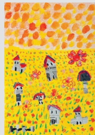
6 e prix